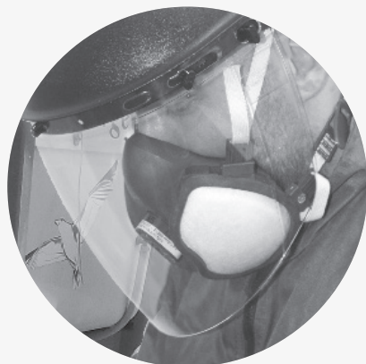
Visière en situation